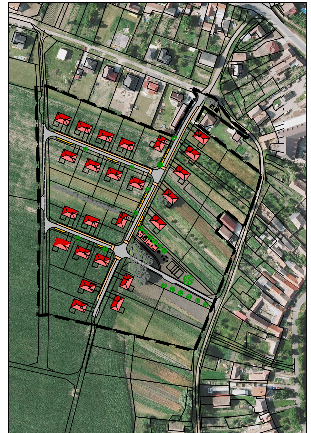
SITUACE DO ORTOFOTOMAPY 1 : 2 500